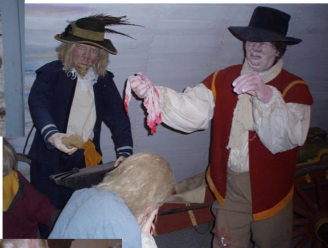
Bild 2 visar tandutdragning i Carlstad.