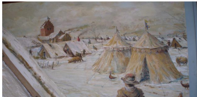
Bild 1 visar hur lägret i Carlstad såg ut – kyrkan som syns är Brunshöjs kyrka som finns kvar än i dag.

Som avslutning på resan gjordes ett besök vid den nya Operan innanför Christianias befästningsvallar.