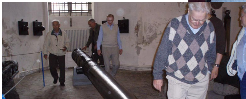
bild 3 en av kanonerna i på Tøjhusmuseet. Text och bild Jan-Åke Krisotffersson.

Till sist: Ett litet ord av ömhet, En nick, en blick, ett skratt, Är för en ensam männ'ska den dyrbaraste skatt.