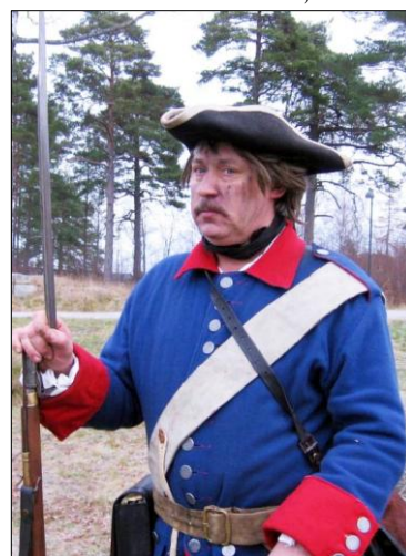
Menig soldat iklädd Nerike-Wermelands caroliners uniform i färgerna blått med rött foder och röda strumpor

Förra våren tog Fritidsförvaltningen bort den båt som Sällskapet tillsammans med Teatersmedjan haft tillgång till. Det har inneburit ett avbräck i möjligheterna att utföra transporter ut till Kastellet vid de delar av året när den ordinarie trafiken inte är igång. Finns det någon som har en oanvänd mindre båt som Sällskapet kan låna så hör gärna av er.