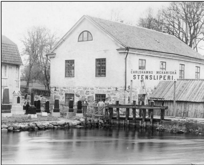
En bild på Tyska Möllan från början av förra seklet efter övergången från kvarn till stensliperi.

Byggnaden uppfördes redan 1718 som en av flera kvarnar längs Mieåns sträckning. Genom åren har byggnaden haft många benämningar som Tyska Möllan, Store Kvarn och Store Mölla. År 1897 övergick kvarnverksamheten till att bli stensliperi. På äldre fotografier kan man se gravstenar uppställda utanför byggnaden. Troligtvis som någon form av varuprov eller stenar klara för leverans. Stensliperiet var igång till slutat av 1960-talet.