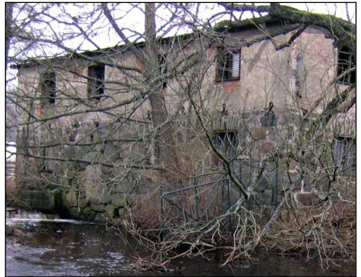
Tyska Möllan 2012. Trots förfallet syns ändå de vackra proportionerna byggnaden en gång hade.