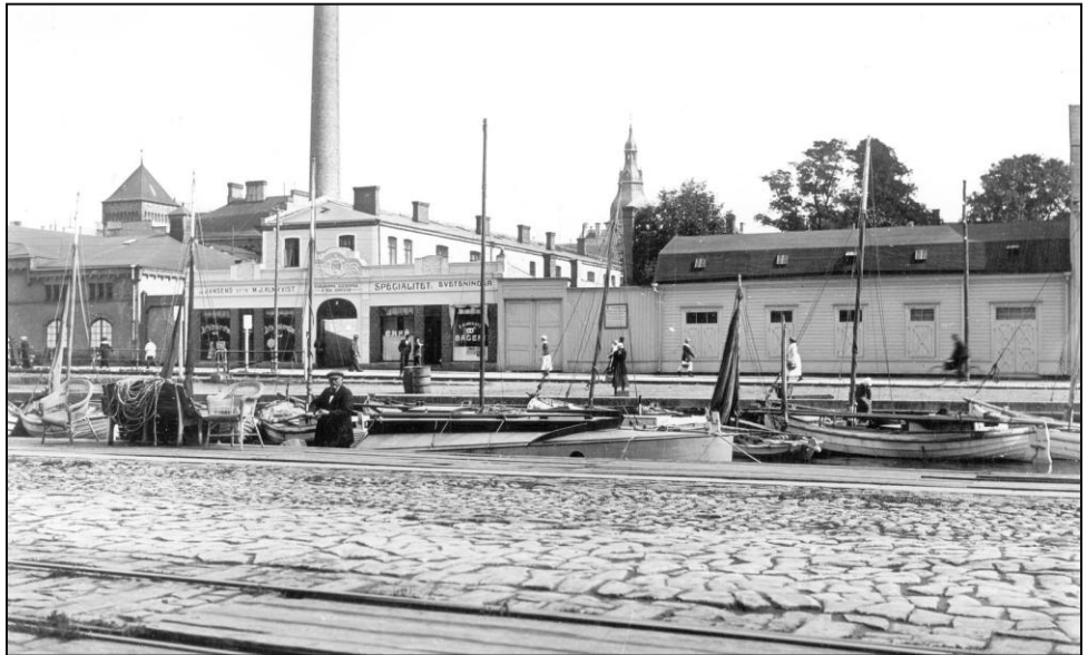
Äldre fotografier är en källa till historien som gjorts möjlig genom internet. Denna bild visar ett parti av Ågatan med Karlshamns elverk till vänster. I bakgrunden skymtar tornet på rådhusets tak.

Riktlinjerna för ett samarbete med Vaggaskolan har påbörjats och från skolans sida är man intresserad av Castellanernas förslag till ett stipendium. Vad som återstår är arbetet med att utforma vilka kriterier som ska gälla för att kunna erhålla stipendiet. Tanken är att stipendiaten presenteras i samband med Syrénfesten och Castellanernas högtidsfest på Kastellet.