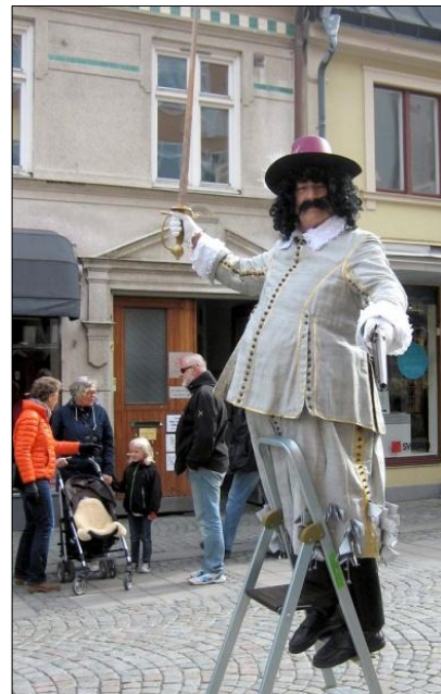
Föreställ er en häst istället för stegen och ni har en ryttarstaty över Karl X Gustav

Uppträdandet var den första av de historiska så kallade flash mobs som Sällskapet arrangerar i samband med Karlshamns 350-årsjubileum. Med all säkerhet kommer Karl X Gustav och hans mannar att dyka upp i lördagshandeln vid fler tillfällen. Så håll utkik när ni torghandlar!